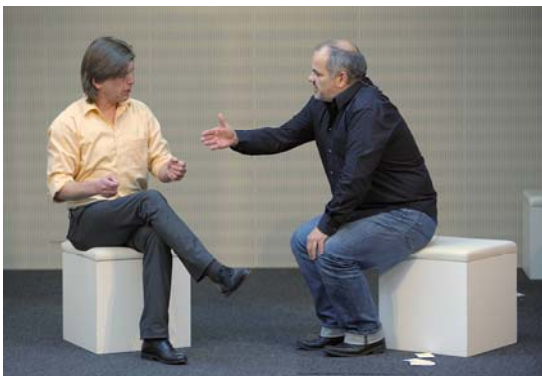
Business-Impro-Show mit Inszenio

Das Künstlerische „an sich“ erhielt auf dem PM Forum viel Raum. Neu war das Konzept der Kulturbühne, die erstmalig in diesem Jahr aufgebaut und deren Programm mit Unterstützung des Projekts Zukunft der Berliner Staatsverwaltung für Wirtschaft, Technologie, Frauen gestaltet wurde. Künstler aus unterschiedlichen Genres verpackten ihre Assoziationen zum Forums-Motto in kurze, spotlightartige Aktionen.